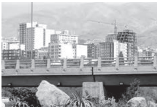
تصویر ۱۷-۶- لنز نرمال