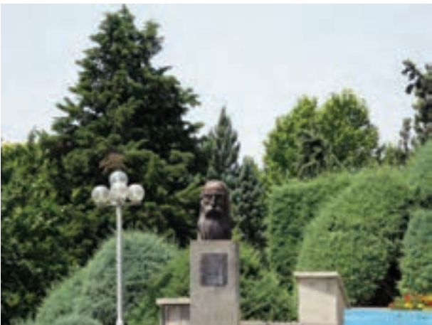
تصویر ۵-۶- لنز تله