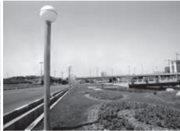
تصویر ۶-۲۱- لنز واید