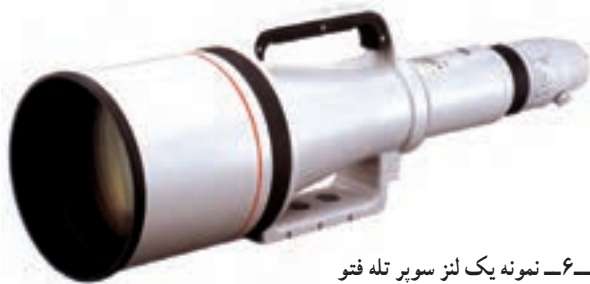
تصویر ۶-۶- نمونه یک لنز سوپر تله فتو