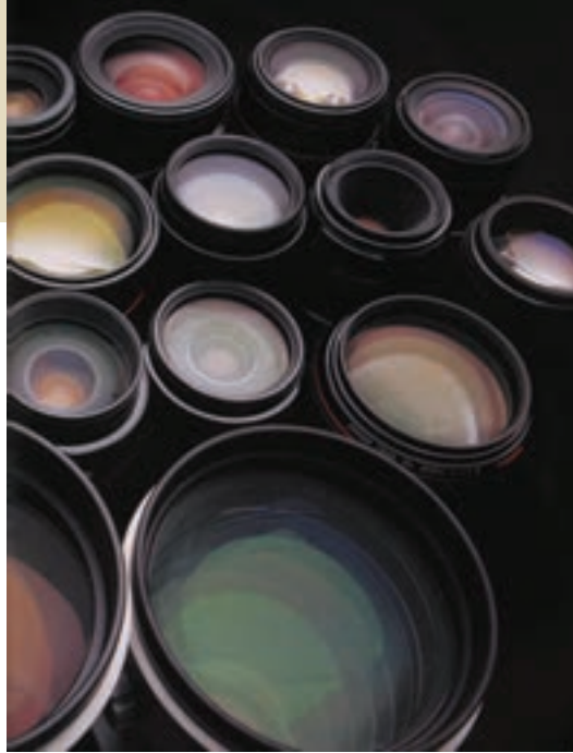
تصویر ۲-۶- پوشش های روی لنز رنگی دیده می شوند.