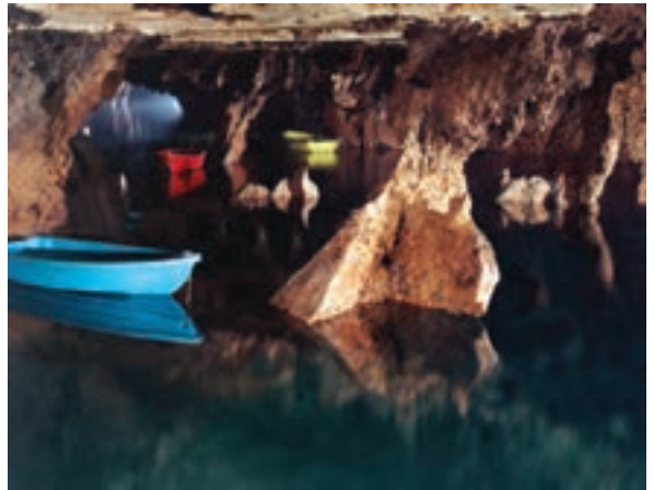
تصویر ۹-۶- لنز واید، غار علی صدر، همدان