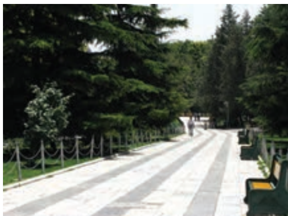
تصویر ۱۹-۶- پرسپکتیو لنز واید