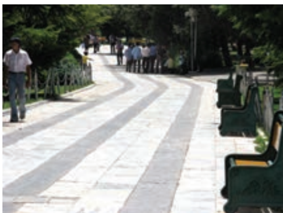
تصویر ۲۰-۶- پرسپکتیو لنز تله