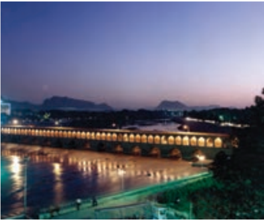
تصویر ۱۰-۶- لنز نرمال، سی و سه پل، اصفهان