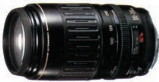
تصویر ۱۲-۶- لنز زوم با مشخصات ، ۱۰۰-۳۰۰ f.4.5-5.6