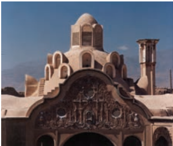
تصویر ۱۱-۶- لنز تله، خانه بروجردیها، کاشان