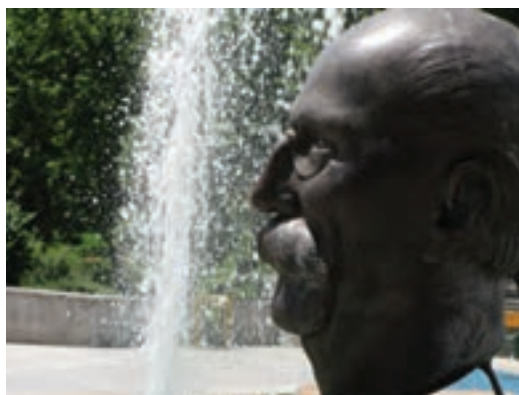
تصویر ۲۶-۶- لنز تله