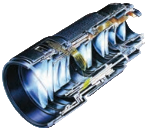
تصویر ۱-۶- تصویری از داخل یک لنز

تصویر تشکیل شده توسط یک عدسی ساده دارای معایب فراوانی است که برای از بین بردن این معایب چند عدسی همگرا و واگرا را با محاسبات دقیق و در فواصل معین از هم قرار می‌دهند، به این گونه عدسی‌ها عدسی مرکب می‌گویند. هر جا که کلمه لنز را به کار می‌بریم منظور مجموعه‌ای از عدسی‌هاست. (تصویر ۱-۶) برای بالا رفتن کیفیت تصویر و جلوگیری از اتلاف نور، روی عدسی‌های لنز را از مواد خاصی و به صورت لایه‌های بسیار نازکی می‌پوشانند علت این که وقتی به لنزها نگاه می‌کنیم سطح آنها را رنگی می‌بینیم همین است. (تصویر ۲-۶) حفاظت از این لایه‌ها بسیار مهم است تا آنجا که ممکن است، باید از کثیف شدن و در نتیجه پاک کردن لنزها خودداری نمود زیرا با از بین رفتن این پوشش‌های رنگی کیفیت لنزها افت خواهد کرد.