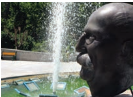
تصویر ۲۵-۶- لنز نرمال