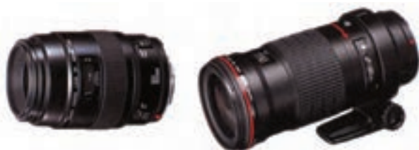
تصویر ۱۳-۶- دو نمونه لنز ماکرو با فواصل کانونی متفاوت

به جز لنزهای ذکر شده لنزهای دیگری هم در عکاسی به کار می رود که بسیار تخصصی است و استفاده همگانی ندارد.